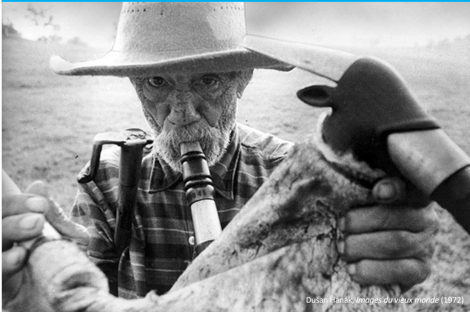
Dušan Hanák, Images du vieux monde (1972)

PROGRAMME DES CONFÉRENCES ŠTEFÁNIK EN 2019-2020 ORGANISÉES PAR L'AMBASSADE DE SLOVAQUIE EN FRANCE