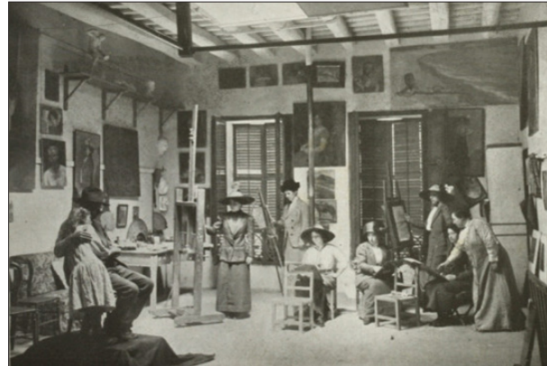
El taller de la notable pintora barcelonia donya Lluisa Vidal, coloboradora de FEMINAL, durant un curs d'apunts del natural pera senyoretetes.

Organisé par le Centre d'études catalanes, Études Catalanes et Arts visuels du CRIMIC (EA 2561) de Sorbonne Université et GRACMON (Grupo de Investigación en Historia del Arte Contemporáneo y Diseño de la Universidad de Barcelona).