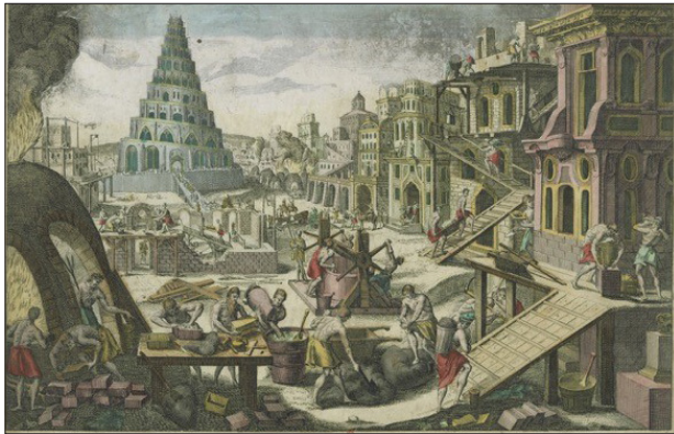
La ville et la tour de Babylone - 1760

(Auto)biographie langagière, conscience linguistique plurilingue, intercompréhension en contexte de romanité