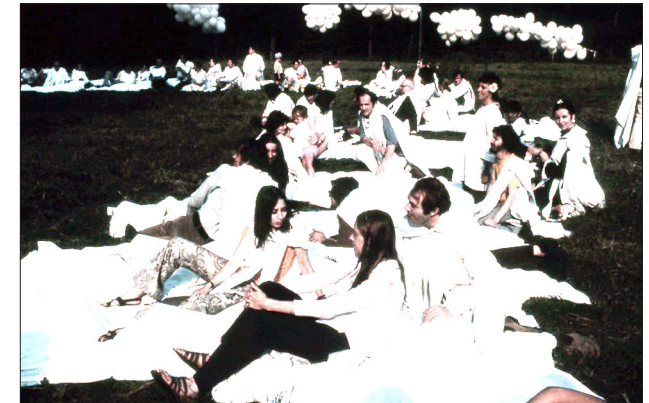
Fête en Blanc, Château de Verderonne, 1970

Une aventure artistique des années 60 : les Catalans de Paris