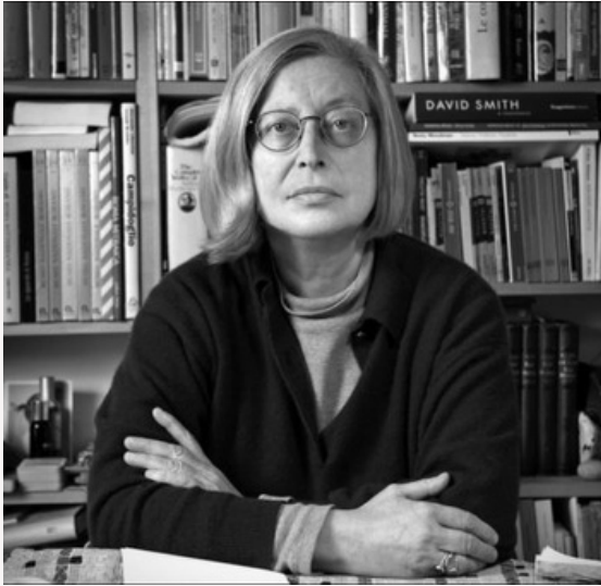
Patrizia Cavalli, Todi 1947 - Roma 2022