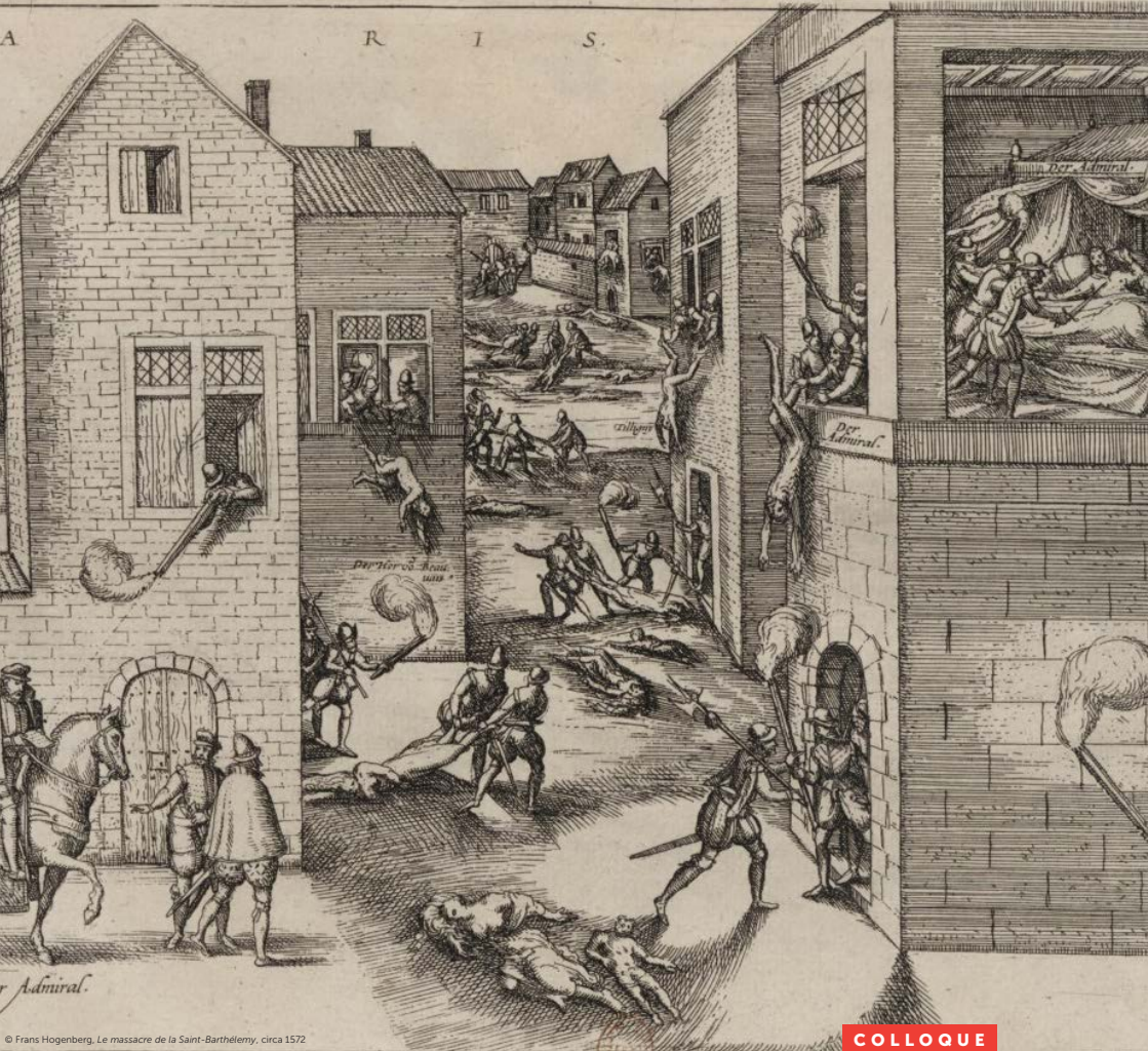
© Frans Hogenberg, Le massacre de la Saint-Barthélemy, circa 1572