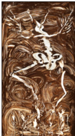
Le Grand Verre de Terre

Master class Miquel Barceló, un artiste sur les traces du Prado ?